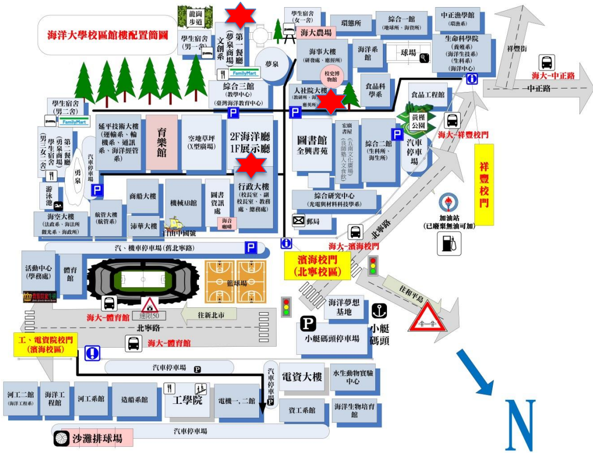
附圖一、國立臺灣海洋大學校區面圖。